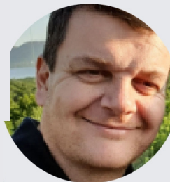
Pr. Christophe Piscart PROFESSEUR À L'UNIVERSITÉ DE RENNES ET DIRECTEUR DE RECHERCHE CNRS, FRANCE

La matinée (de 9h à 12h) Salle des Visioconférences